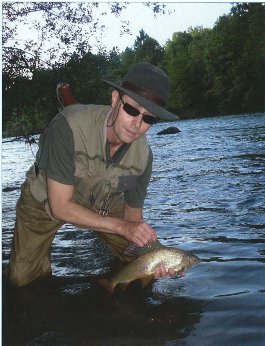
SAVAN HARIJUS. Savan kalasto koostuu pääasiassa taimenesta, kirjalohesta ja harjuksesta. Kalat ovat todella kauniita.

jatkuvaa kalojen väsyttelyä ollut. Vaikka huopeet ja montut olivat todella hyvännäköisiä, en aluksi vain onnistunut muuhun kuin pariin hyvään tärppiin ja muutaman hetken kestäneeseen kosketukseen siiman päässä olevan kalan kanssa.