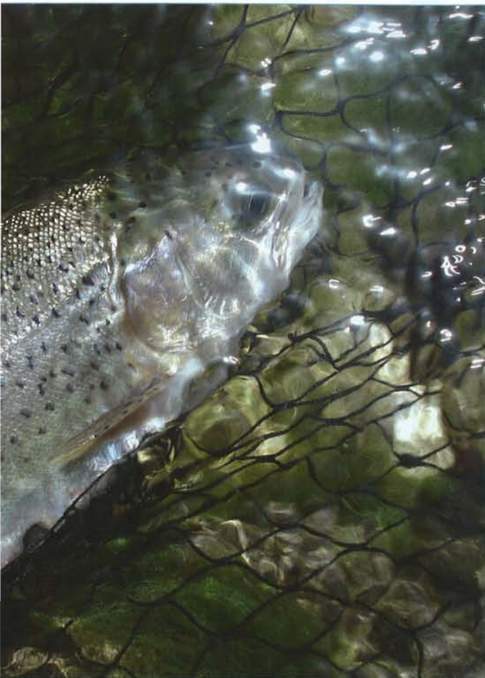
KIRJO HAAVISSA. Luonnonkudusta syntynyt pieni kirjolohikin on todellinen taistelija.