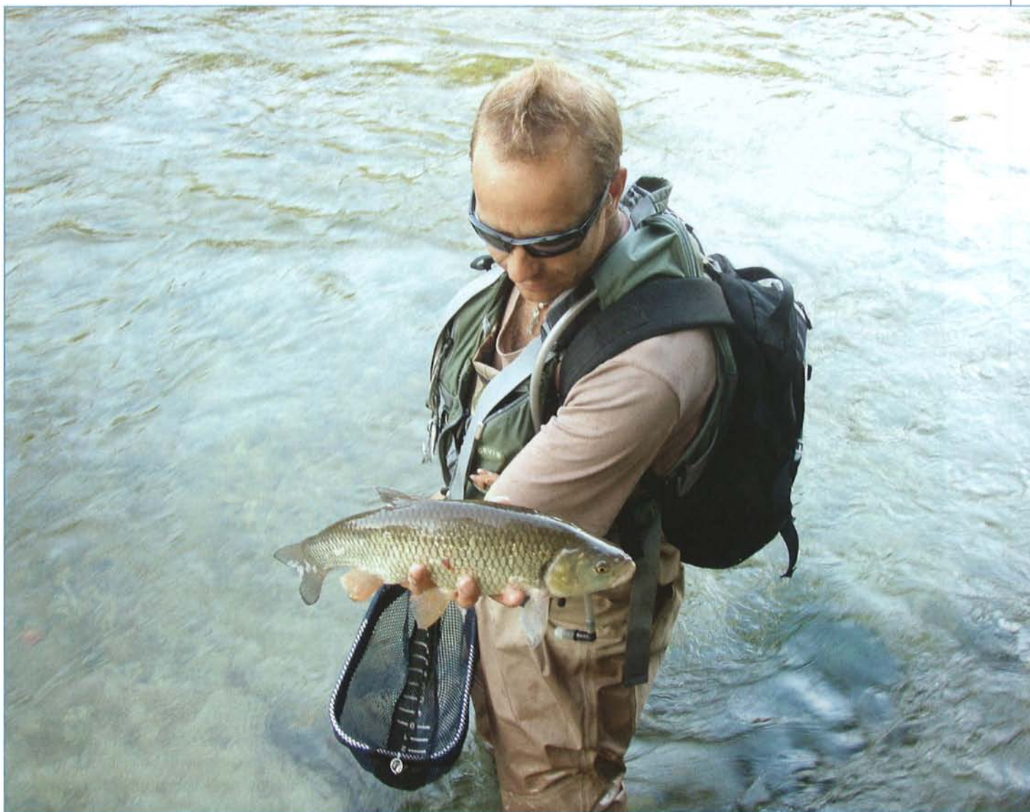
ROK JA SÄYNE. Muitakin kaloja kuin rasvaevällisiä Slovenian joista löytyy. Näistä etenkin jokibarbit ovat mainioita urheilukaloja.