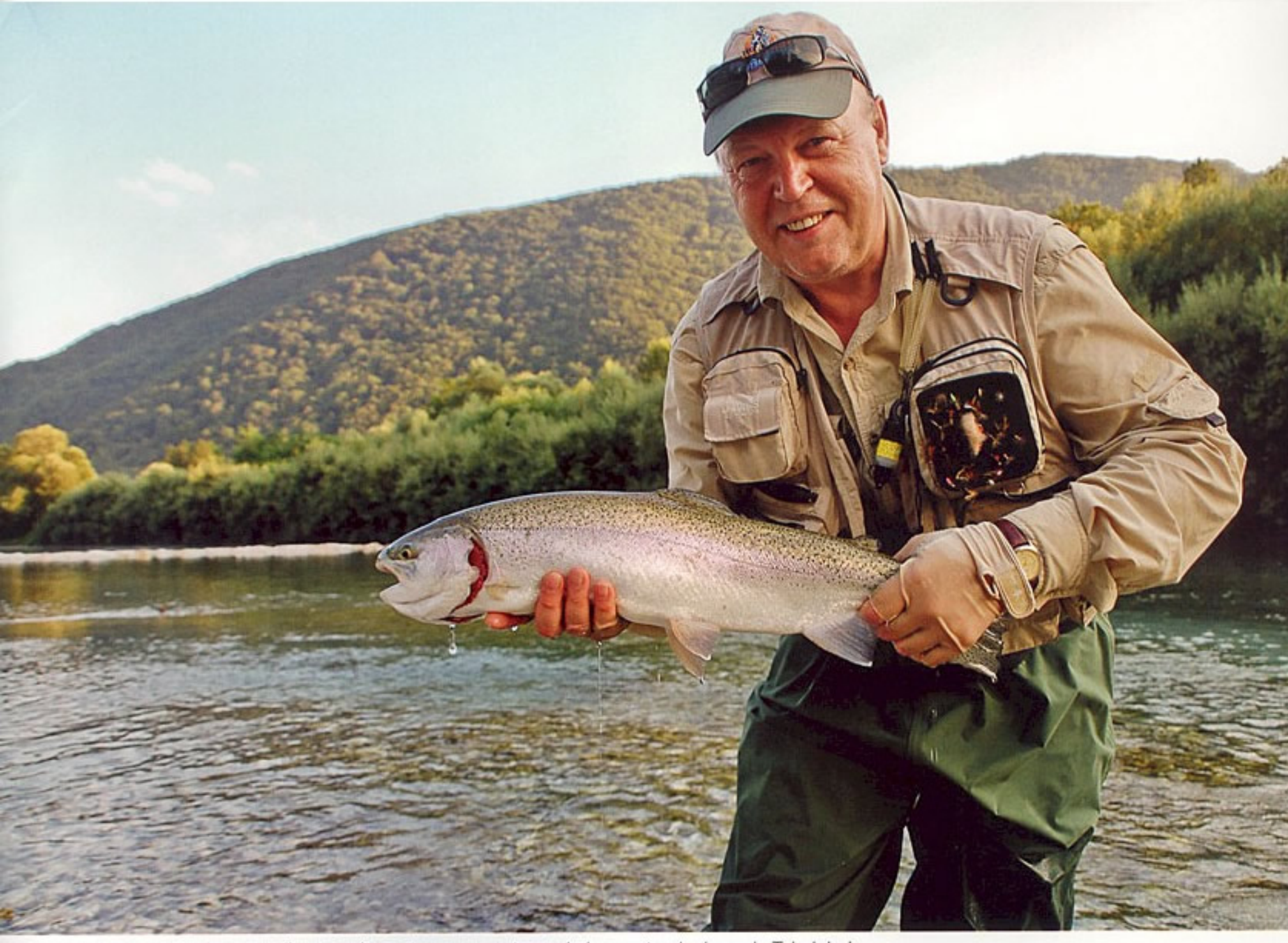
Een kanjer regenboog, weliswaar uitgezet, maar sport van de bovenste plank op de Tolminka!